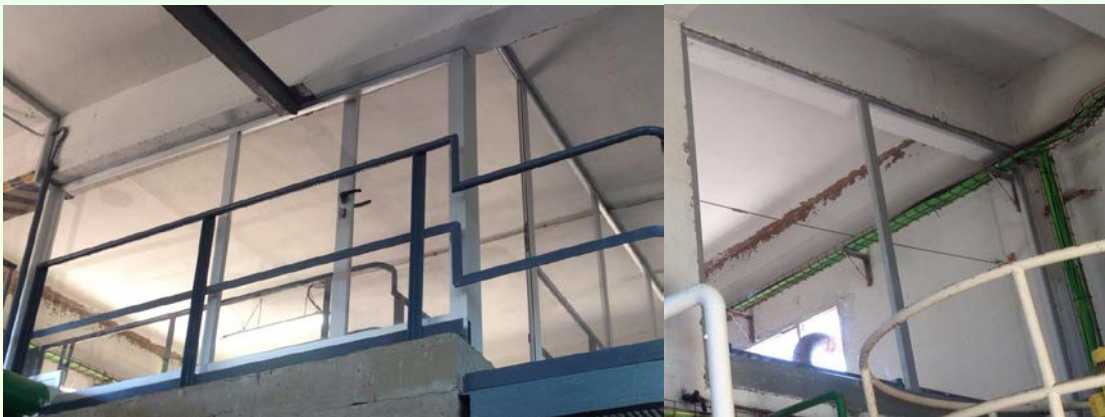
Foto 2: Puerta (izquierda) y ventana (derecha) de policarbonato compacto incoloro

3.- Una vez colocado, sellar los bordes de las 2 caras (tanto la exterior como la interior) con silicona neutra.